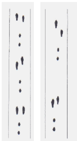
Hase hoppelnd Hase flüchtend

An den Hasenspuren kann man erkennen, ob ein Hase gemütlich über die Felder gehoppelt oder vor seinen natürlichen und unnatürlichen Feinden (Füchse, Raubvögel und der Mensch) in höchster Eile geflohen ist.